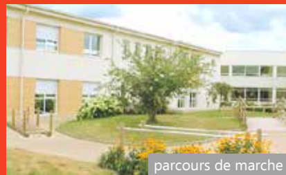
parcours de marche