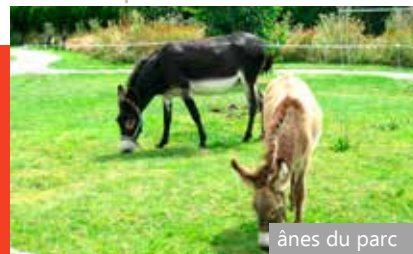
ânes du parc

La Résidence est située au cœur de la ville de Lamballe, à proximité des commerces et d'un supermarché, des activités culturelles (bibliothèque, cinéma...) et des infrastructures administratives, sanitaires et sociales (mairie, cabinet médical, maison médicale de garde...) et du Haras National.