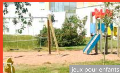
jeux pour enfants