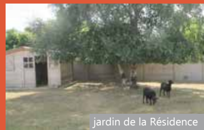
jardin de la Résidence

De nombreux sites naturels et historiques (grande plage de Saint-Cast-le-Guildo, Presqu'Île de Saint-Jacut-de-la-Mer, Château du Guildo) se trouvent aux alentours.