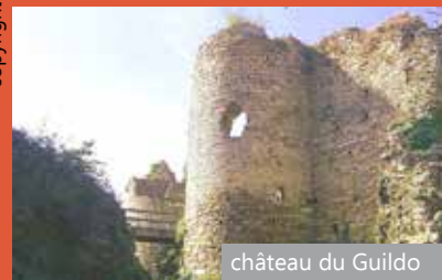
château du Guildo