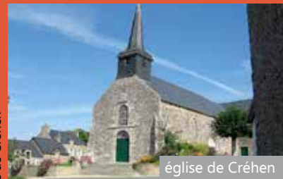
église de Créhen