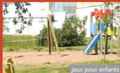
jeux pour enfants