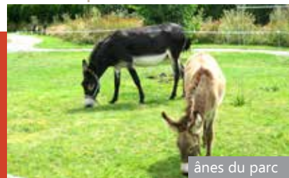
ânes du parc

La Résidence est située au cœur de la ville de Lamballe, à proximité des commerces et d'un supermarché, des activités culturelles (bibliothèque, cinéma...) et des infrastructures administratives, sanitaires et sociales (mairie, cabinet médical, maison médicale de garde...) et du Haras National.